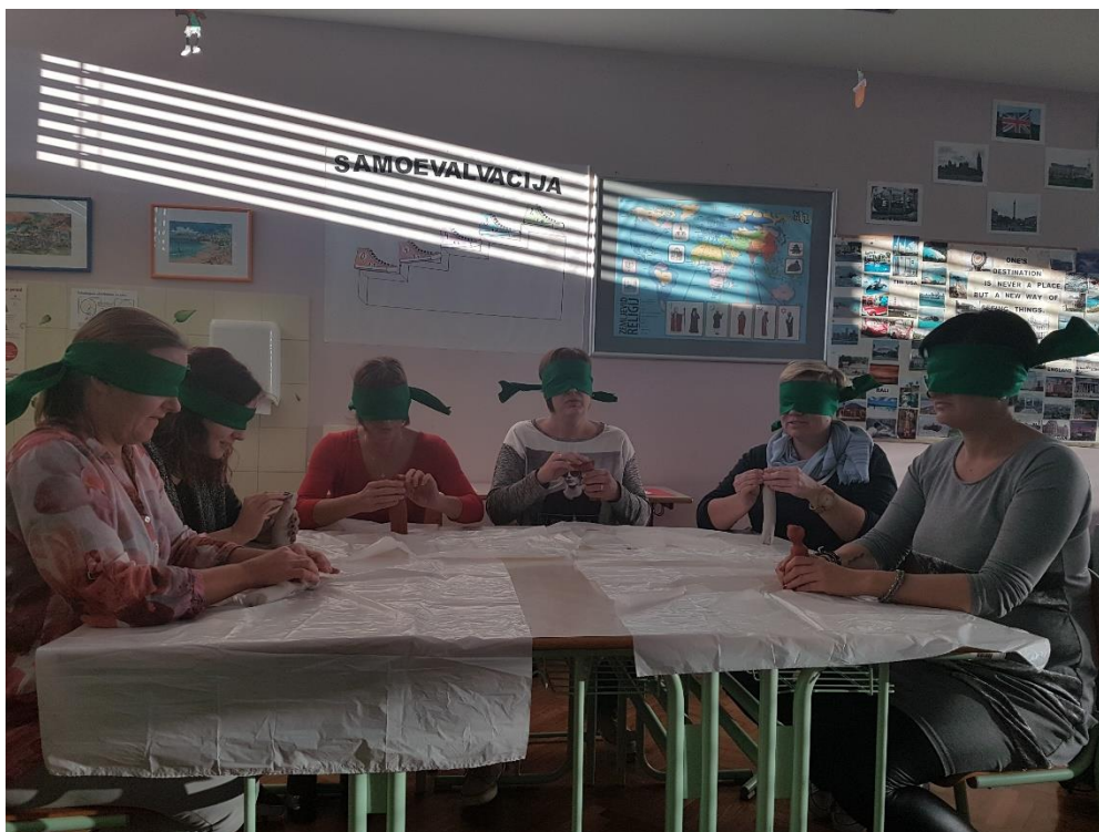
Sprejemanje informacij preko različnih čutil.